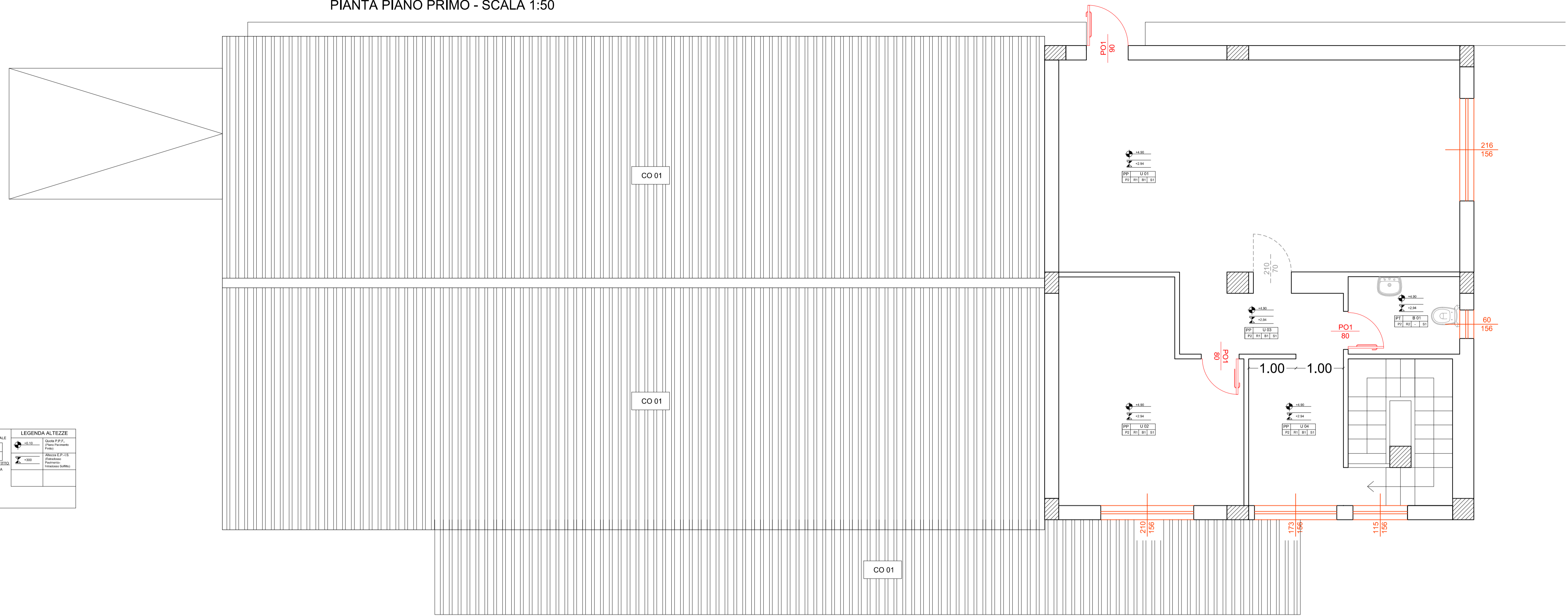
PIANTA PIANO PRIMO - SCALA 1:50