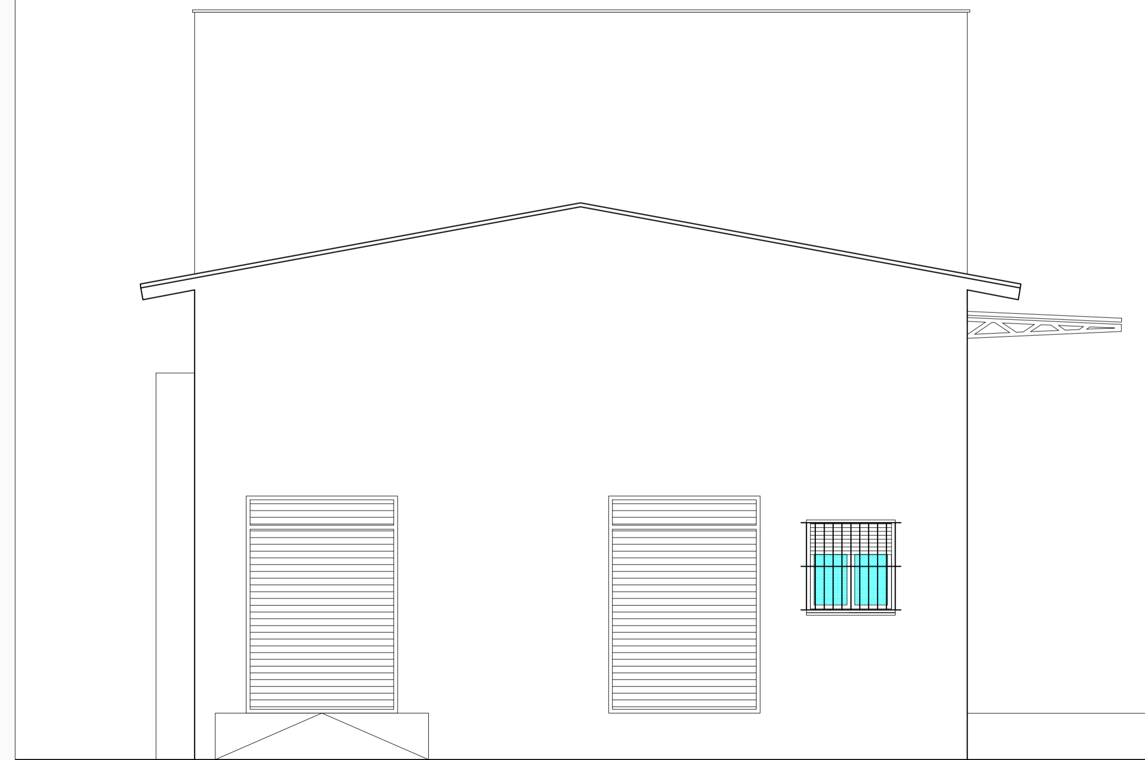
PROSPETTO OVEST - SCALA 1:50